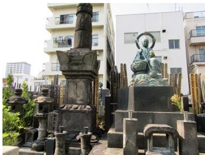
家康の側室阿茶の局の墓