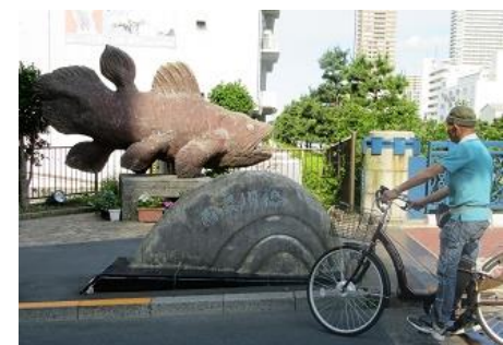
小名木川沿いのシーラカンス