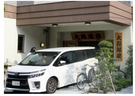
大鵬道場・大嶽部屋