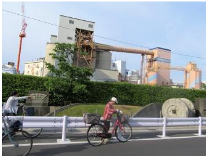
本邦セメント工業発祥の地