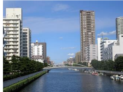
舟の浮かぶ小名木川