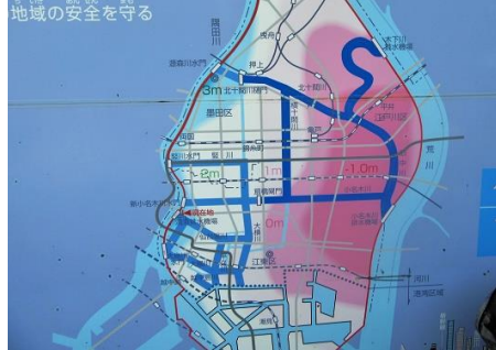
下町の安全を守る清澄排水機場