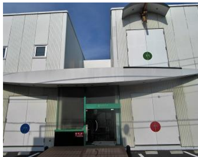
セゾン文化財団森下スタジオ