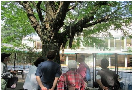
霊岸寺の江東区保護樹の気根