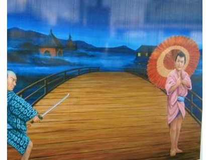
えんま堂前の黒亀橋