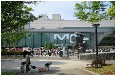
長蛇の列の東京都現代美術館